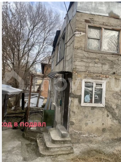
ход в подвал