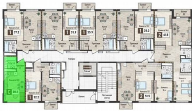
ПЛАН 2-ГО ЭТАЖА 2 подъезда