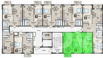
План 2-й ЭТАЖИ 7 комнат